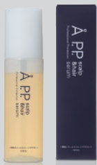
エービーピー スカルプ&ヘアセラム