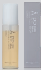
エービーピー スカルプ&ヘアセラム